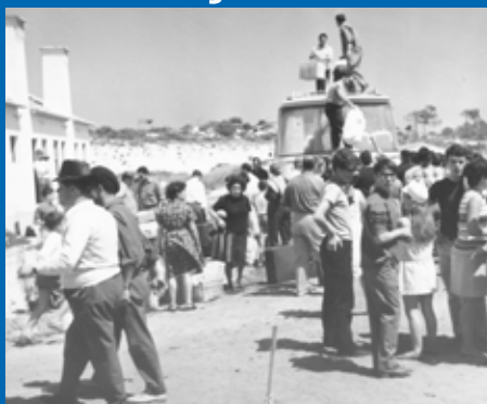
Chegada dos primeiros veraneantes a colónia de férias de Vieira de Leiria, a primeira dos Serviços